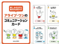
コミュニケーションカード